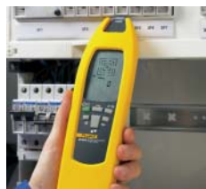
Определение местонахождения предохранителей/прерывателей и привязка к цепям